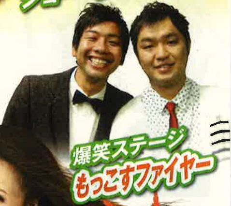
爆笑ステージ もつとすふあや