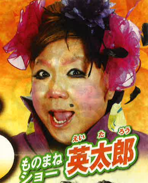
えいたろう ものまね 英太郎 ショー